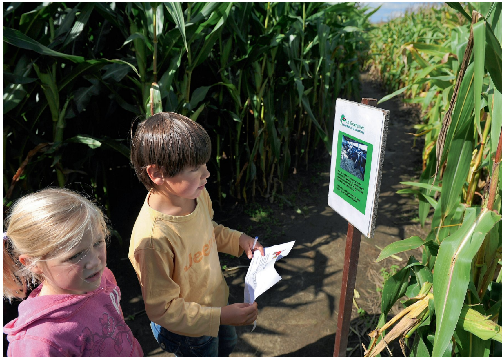
Kinderen beantwoorden vragen tijdens een kinderfeestje in het doolhof van Stoutenburg.